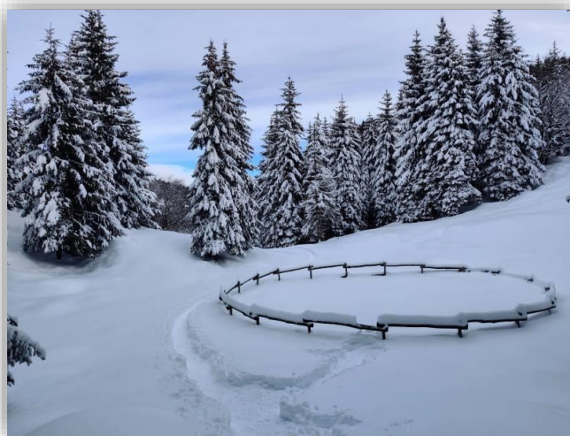
Sentiero per Baita Golla