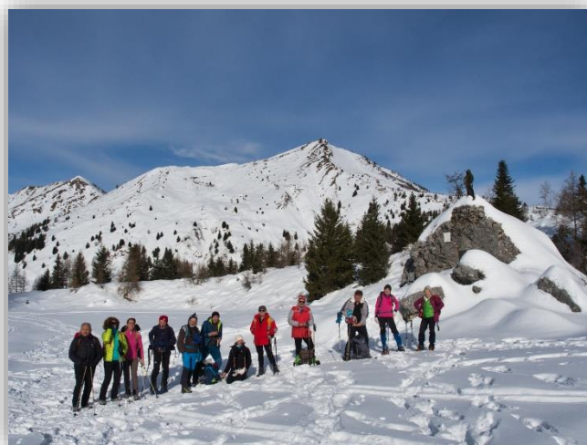
Madonnina dei Campelli - 07 febbraio 2019

Da: Schilpario località Fondi (m.1261) ↑ Cimalbosco (m. 1573) ↑ Rifugio Cimon della Bagozza (sempre aperto) ↑ Conca dei Campelli (m.1710) ↑ Malga alta dei Campelli (m.1812) ↑ Passo dei Campelli (m. 1892) ↑ Rifugio Campione (m.1946) Facoltativo: ↑ Monte Campioncino (m. 2096) Ritorno: stesso percorso Dislivello totale: m.850 Lungh. Km 13~ Tempi indicativi: salita h.3.00 discesa h. 2.30 Difficoltà: E (escursionistico) Ritrovo: ore 7.00 (Villa Regina P.)