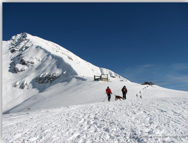
Dorsale in vista di Capanna 2000