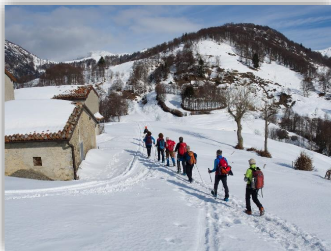
Baite della Sella (m 1400) - 20 febbraio 2021

Da: Avolasio in Val Taleggio (m.1050) ↑ Alpeggio Prato Giugno (m.1168) ↑ Prato del Tona (m.1386) ↑ Prati della Sella (m.1371) ↑ Baita della Sella Bassa (m.1425) ↑ Baita della Sella Alta (m.1541) ↑ Rifugio Sassi Castelli (m.1650) Dislivello totale: m.750 Lungh. Km 13,5 Tempi indicativi: Salita h 3.00~ tot: ore 5.50~ Difficoltà: E (escursionistico) Ritrovo: ore 6.30 (Villa Regina P.)