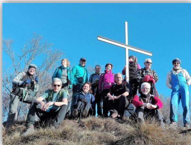
Croce del Grione – Escursione 26 gennaio 2017