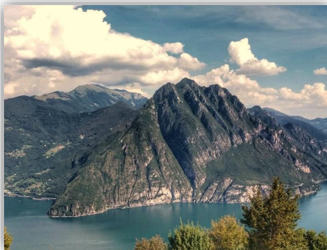
Corna Trentapassi vista da S. Defendente