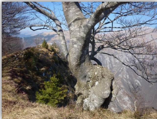
Faggi sulla cresta del Monte Vaccareggio

Da: Villa di Dossena Val Serina (m.1070) Parcheggio in via Villa presso B&B Le Touriste ↑ Sent. CAI 599A Frazione Lavaggio (m 1190) ↑ Baita M. Predozzo (m 1228) segnavia Blu ↑ Laghetto con Bivio (m.1330) ↑ Monte Vaccareggio (m 1474) Ritorno: Lungo la cresta con Sentiero CAI 599B ↓ Val di lavaggio (m.1140) ↑ Frazione Lavaggio (m 1190) ↓ Dossena via Villa Dislivello totale: m.500 Lungh. Km 7 Tempi indicativi: salita h.3.00 discesa h. 2.30 Difficoltà: E (escursionistico) Ritrovo: ore 7.00 (Villa Regina P.)