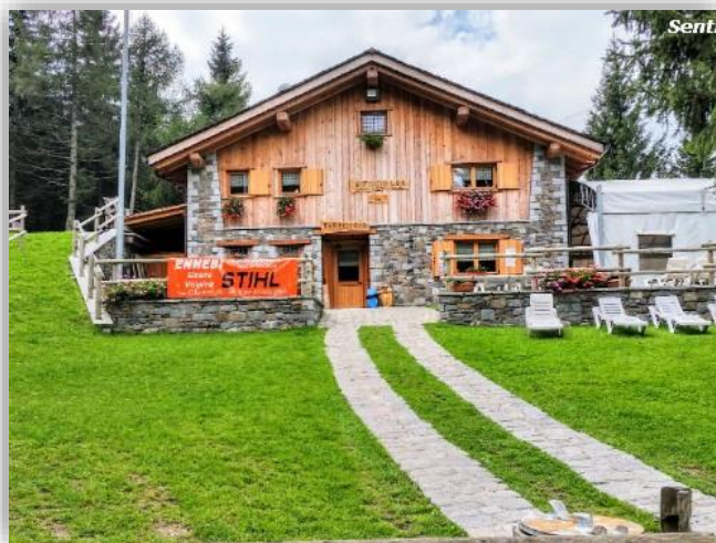
Rifugio Loa (m 1197)