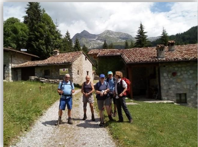
Baite del Möschel - Escursione 05 luglio 2018