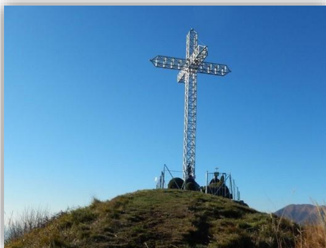
Croce del Monte Megna