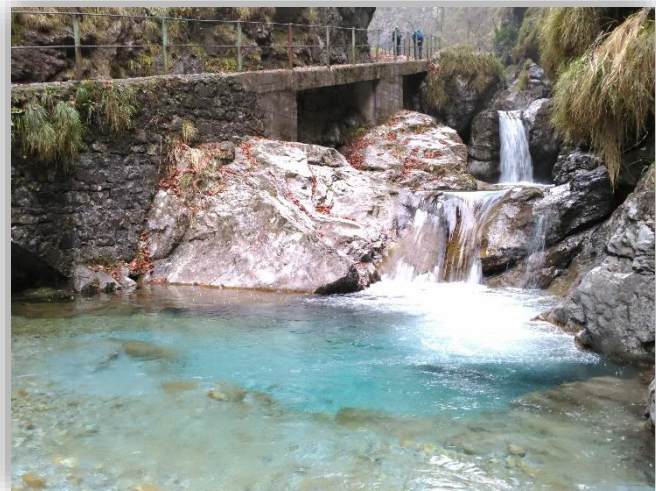
Val Vertova – Escursione 06 dicembre 2018