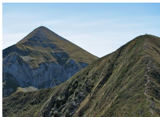
Dalla Forc.Rossa: Monte Cavallo e Cima dei Siltri