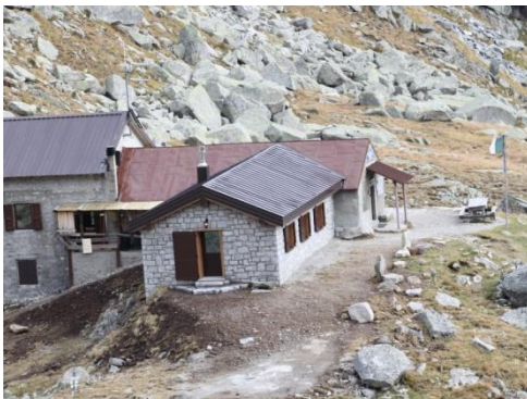
Rifugio Tonolini (m.2450)

Escursione ai Laghi Gelati: Dal rifugio, costeggiando il lato occidentale (a Sinistra) del piccolo limpidissimo Lago Rotondo e seguendo i segnavia (Cai n°50) si risale una ripida valletta per sfociare una semipianeggiante conca acquitrinosa. Raggiunto il bel Lago Lungo (m.2519) lo si supera sulla sinistra e si rimonta un'altra scoscesa vallecchia che porta al gradone ospitante gli splendidi Laghi Gelati. Da qui, abbandonando il S.V.50, spostandosi decisamente verso sinistra, si tocca in pochi minuti il lago Gelato occidentale (m.2751) circondato da coloratissime rocce. Volgendo invece a destra sulla morena, ci si affaccia in breve al più grande e suggestivo lago orientale (m.2783)