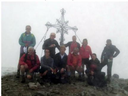
Corno Stella (m.2621) 20/06/2013

Ritorno: dal P.so di Valcervia scendendo lungo il versante sud del Monte Toro, raggiungeremo in ordine: Laghetti di Montebello (2272 m), Laghetto Foppe alto (2268 m) Laghetto Foppe basso (2183 m), e Laghetto delle Trote (2109 m). e con un traverso si ritornerà alla stazione di arrivo della seggiovia di Montebello