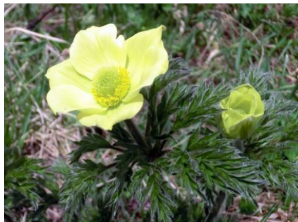
Anemone Sulforosa (Pulsatilla)