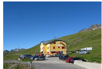
Rifugio Berni (m.2541)