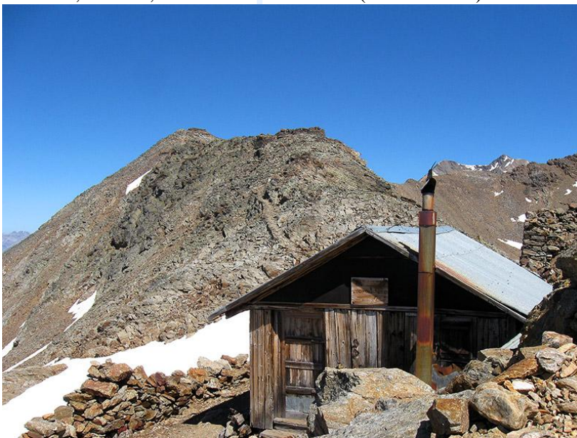
Biv. Battaglione M. Ortles (m.3120)

mantiene alla destra del ghiacciaio, costeggiando il costone meridionale della Cima di Val Umbrina. Giunti ad una quota di circa 3000 metri, si lascia la vedretta alle nostre spalle e, verso sinistra, si risale una vecchia traccia di guerra sino a raggiungere la cresta ove sorge il bivacco Ortles. Da qui seguendo la cresta verso sinistra in mezzora si è sulla vetta. Il percorso è reso estremamente suggestivo dalla presenza dei ruderi dei baraccamenti del fronte di guerra. Dalla vetta si gode di un ottimo panorama a 360°: Pizzo Tre Signori, S. Matteo, Tresero, Adamello e Presanella. (3 h e 30 min.).