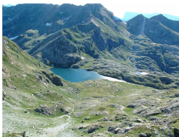
Veduta del laghi dal Passo di Domignone