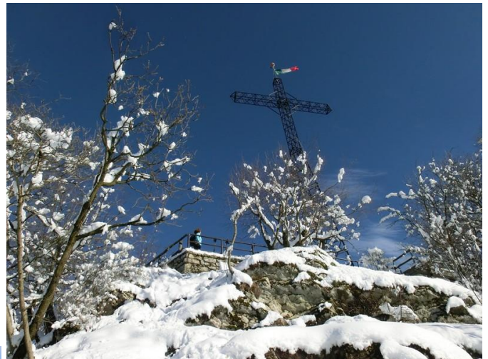
Croce Monte Ubione - Escursione 08/02/2015

Riprendiamo il cammino e spalle alla croce, dalla parte opposta da dove siamo saliti (cartello WC), scendiamo seguendo il ripidissimo crinale a nord (da evitare in presenza di ghiaccio o neve). Arrivati di nuovo alla verde sella Roccoli della Passata, Proseguiamo sulla dorsale in leggera salita sul Sentiero del Partigiano (571), rientrati nel bosco in breve arriviamo a un bivio, proseguiamo a destra, quello di sinistra in direzione del traliccio, non ha sbocco. Al secondo bivio ignoriamo il cartello che ci consiglia di proseguire verso destra e dopo qualche minuto raggiunto l'ennesimo capanno di caccia, seguiamo l'indicazione su un cartello, compiendo una breve deviazione, per poi tornare sulla cresta che unisce il Monte Ubione alla Corna Marcia.