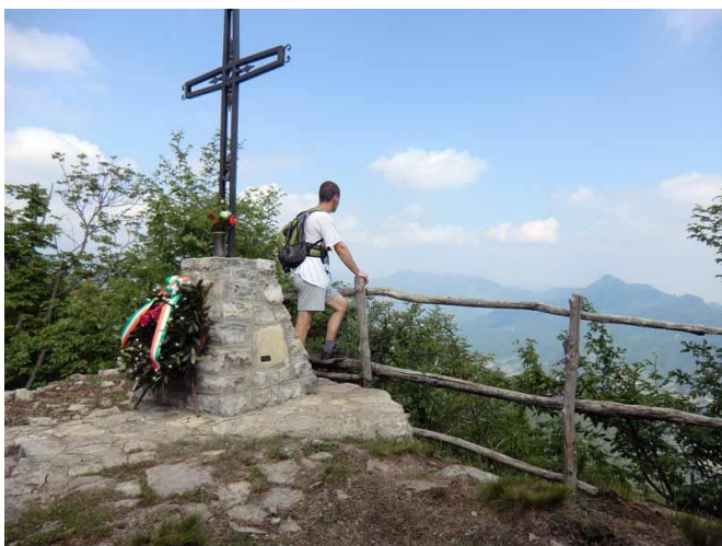
Croce Corna Marcia (mt. 1033)

Attraversato un tratto caratterizzato da alcuni grandi massi calcarei, con alcuni saliscendi arriviamo a un ulteriore capanno, costeggiamo la recinzione di confine fino al suo termine, per poi arrivare nei pressi di una grossa pozza fangosa. Poco dopo abbandonato il Sentiero del Partigiano che prosegue a sinistra verso cascina Como, continuiamo a salire, incontrando a breve le indicazioni per la Corna Marcia. Alternando brevi tratti in salita e discesa, appena usciti dal bosco, proseguiamo su un'ampia strada sterrata proveniente dal vicino paese di Berbenno. Continuiamo sempre dritti sulla strada sterrata, ignorando alcuni bivi. Seguendo le indicazioni di una grossa freccia in legno, rientriamo nel bosco e con un ultimo sforzo arriviamo alla piccola croce di vetta 1033 m.