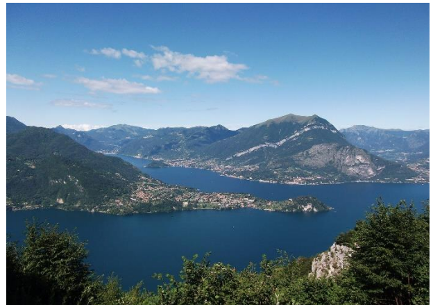
Verso Bellagio (al vertice dei due rami del lago)

Lasciato a destra l'itinerario 72b si prosegue diritti seguendo i segnavia del sentiero n. 71 raggiungendo la splendida radura dell'Alpe di Mezzedo (m 871). Qui conviene abbandonare per un attimo il sentiero e traversare