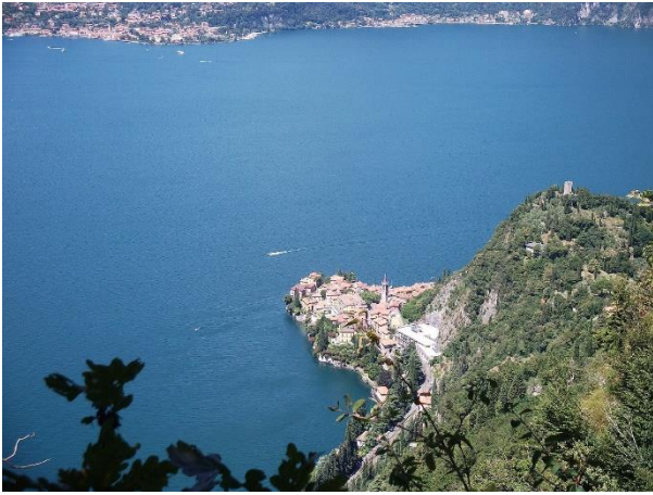
Verso Varenna (la perla del lago)

verso Ovest fino ad affacciarsi sul lago per godere di una magnifica vista (all'Alpe di Mezzedo si trova anche una caratteristica neviera circolare). Tornati sul sentiero si prosegue la salita e, dopo aver ignorato una deviazione che va a destra, si raggiunge in pochi minuti un bivio segnalato: qui si abbandona l'itinerario 71 che prosegue a destra verso l'Alpe di Lierna e si va a sinistra (cartello) verso San Pietro e Ortanella (è ancora l'itinerario 71). Superato ancora un bel tratto panoramico (all'inizio del quale si può salire, sulla sinistra, su un pulpito roccioso che domina l'Alpe di Mezzedo e il lago) si raggiunge un'ampia radura erbosa (Piano di San Pietro – a sinistra si raggiunge la bella chiesetta di San Pietro, 992 m) raggiunta da una strada sterrata (cartello). Si prosegue verso Nord, seguendo la sterrata o attraversando il prato, e si raggiunge un bivio (cartello) si prende a sinistra in leggera discesa, si attraversa