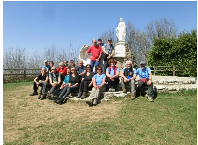
Il gruppo a S. Maria del Giogo - 9 aprile 2015