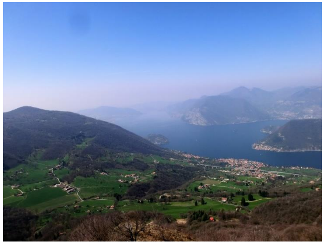
S. Maria del Giogo – 9 aprile 2015