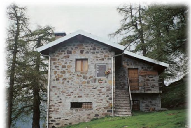
La Cascina di Malga Campellio (m.1550) sulla facciata una lapide ricorda i tre partigiani qui uccisi.

Dalla Cascina Campellio, sulla cui facciata è infissa una lapide dedicata a tre partigiani, inizia la strada del ritorno che si intraprende ripercorrendo il cammino prima compiuto fino al serbatoio dell'acqua. Tornati sulla stradina dalla quale eravamo giunti, la percorreremo non nel verso contrario dal quale eravamo arrivati, ma in modo da descrivere un anello che si chiuderà a Pra' del Larice. Qui si incontra una strada cementata che, raggiunta la vicina "casa-colonia", la supera e, attraversati prati e boschi, raggiunge una vasta area di picnic; oltre questa, superati due bivi (fare attenzione alla segnaletica!), la stradina si immette in un ripido valloncetto al cui termine, dopo alcune case ex fienili, attraversa le località Pra' di Roncazzo e Pra' di Bosco, per entrare nuovamente nel bosco. Più avanti il sentiero sbucca di nuovo sulla stradina sterrata con fondo a tratti acciottolato e poi del tutto asfaltata fino al bivio per la località Albere (m 950). Attraversata l'aia della casa di Albere, il percorso devia su un sentiero-tratturo che, superata la località Ronchei (ci sono due case-fienili), in breve ci porterà alla frazione Piazze di Artogne (m 680); passando sotto la chiesa di Piazze e girando a destra, imboccheremo un sentiero inizialmente prativo che, in ripida discesa, entra nel bosco e ne esce sui declivi sovrastanti Gianico; oltrepassata una lapide in ricordo di un partigiano caduto il 4 novembre 1944, entreremo alla fine in paese.