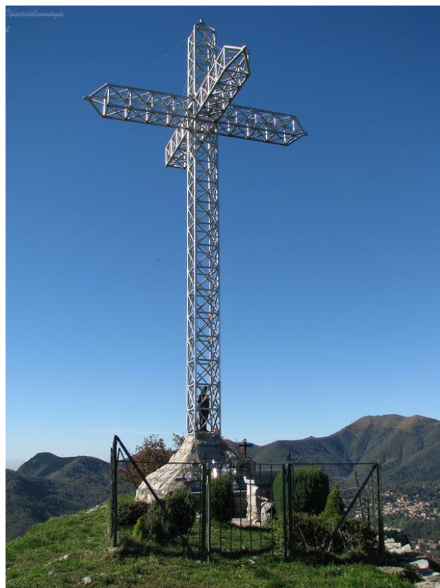
la croce del Monte Megna (m.1049)

Per chi prosegue: dopo circa 300 m prendiamo una strada a sinistra con sbarra di color verde (è possibile anche continuare dritti su asfalto fino al ristorante "La Madonnina" e da qui procedere per la sterrata) che termina dopo un tornante destrorso all'ingresso di una villa. Poco prima di arrivare al cancello della villa entriamo nel bosco e per tracce di sentiero ci alziamo di circa 20 m di dislivello fino ad uscire nei prati sopra il ristorante "La Madonnina" e seguendo il sentiero ci immettiamo sulla sterrata che conduce al ripetitore di vetta del monte Colla 1097 m (10,4 km). Proseguiamo per cresta e dopo alcuni sali/scendi siamo in vetta al monte Oriolo 1092 m (11,2 km). Ha inizio una bella discesa flow di single track fino al laghetto di Crezzo 800 m (13,6 Km) da dove si riprende il tracciato originale del Monte Megna.