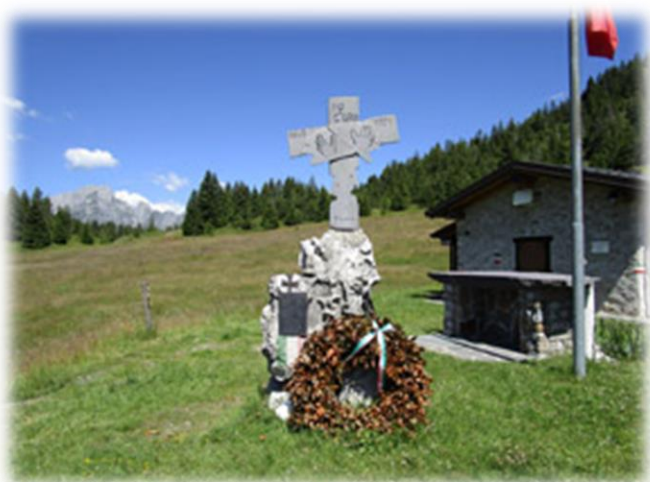
Rifugio Lorenzini e Presolana sullo sfondo

Il ritorno è previsto lungo le piste sci che passando dalla bella località "Pian d'Aprile" prosegue sfruttando le piste fino al parcheggio.