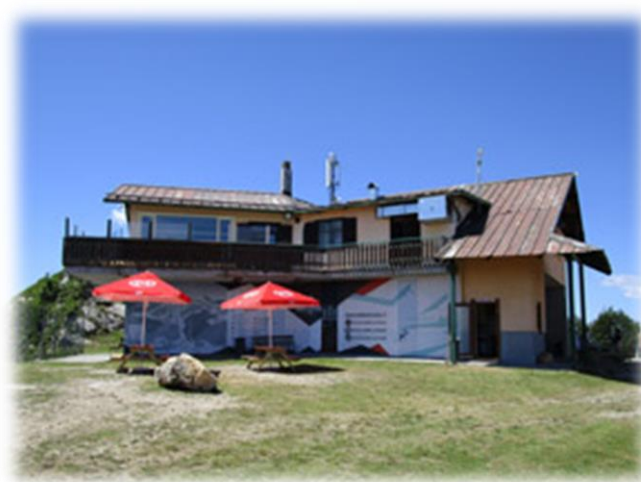
Rifugio Monte Altissimo