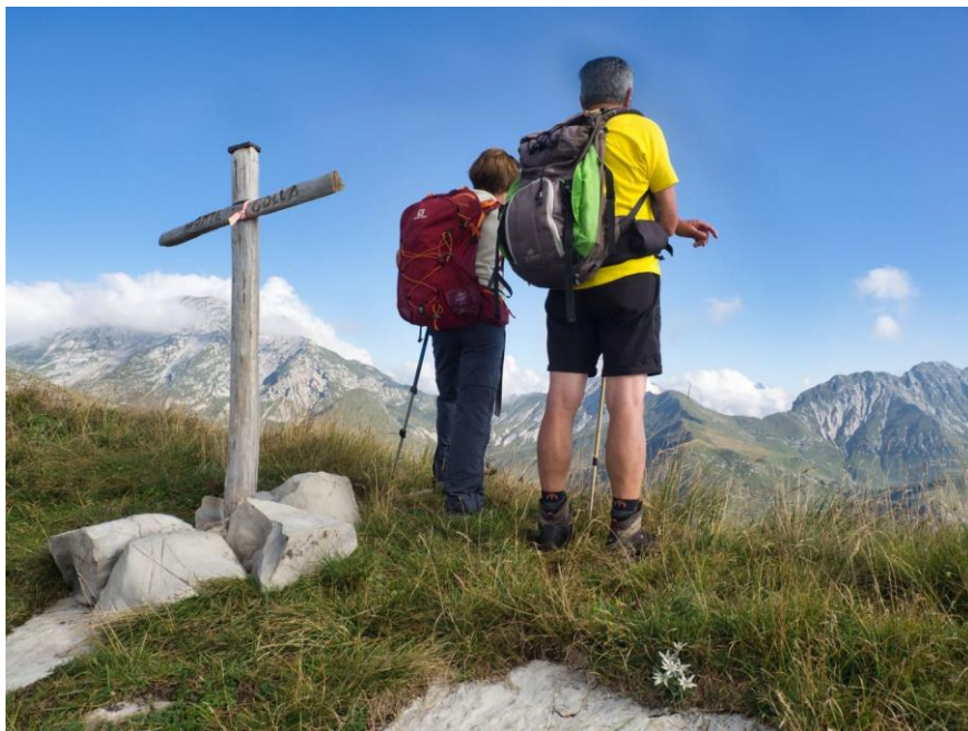
Monte Golla (m.1983) Escursione del 5 settembre 2019

Guidati dai numerosi segnavia si segue la traccia di sentiero nel pascolo fino ad una pozza per l'abbeverata del bestiame adiacente alla Baita Corna (1560 m), non visibile in quanto celata dal dossetto alla nostra sx. Sempre seguendo i segnavia si sale in modo deciso puntando all'evidente crinale con la Valle Nossana (dove il monte Golla cade con un vertiginoso salto di circa 1000 m) e, una volta raggiunto, lo si segue salendo a sx fino alla sommità