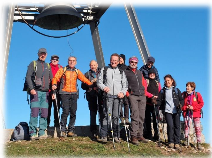
Escursione al Monte Bronzone del 10/11/2016)

La strada diventa ora asfaltata, superata la frazione di Pezze, si raggiunge la chiesetta della Madonna del Monte Oliveto e si prosegue restando su via pezze fino a via Forno, imboccata verso destra si raggiunge la frazione Forno di Adrara S. Rocco; attraversato il ponticello sul torrente Guerna, si risale alla piazza della chiesa parrocchiale da via Vizzanga e Via G. Marconi.