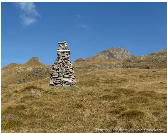
Il grande omino di pietra, segnava tra i due laghi

Consiglio da farsi quando si è allenati, il posto è tanto bello che ricompensa della fatica