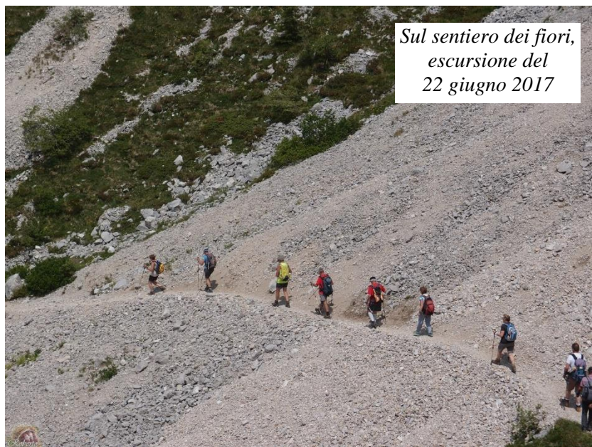
Sul sentiero dei fiori, escursione del 22 giugno 2017