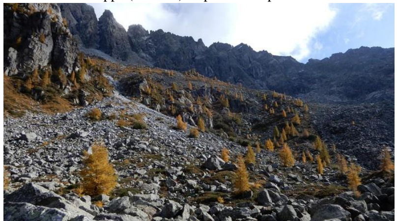
La conca morenica della Foppa

Un'altra scarsa ora, seguendo il facile sentiero CAI 1, ci riporta sulla strada del monte Colmo, poco sopra all'area di pic-nic e al parcheggio.