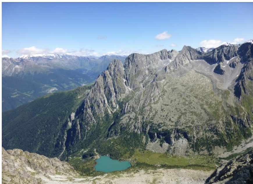
Rifugio e lago di Aviolo (versante opposto) in progr.il 22 set 2022