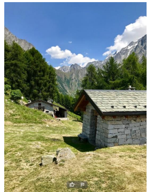
Rifugio Malga Stain