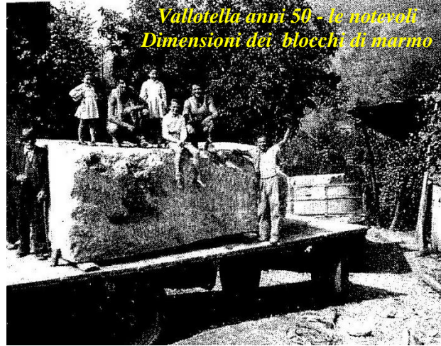
Vallotella anni 50 - le notevoli Dimensioni dei blocchi di marmo