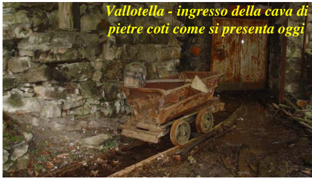
Vallotella - ingresso della cava di pietre coti come si presenta oggi