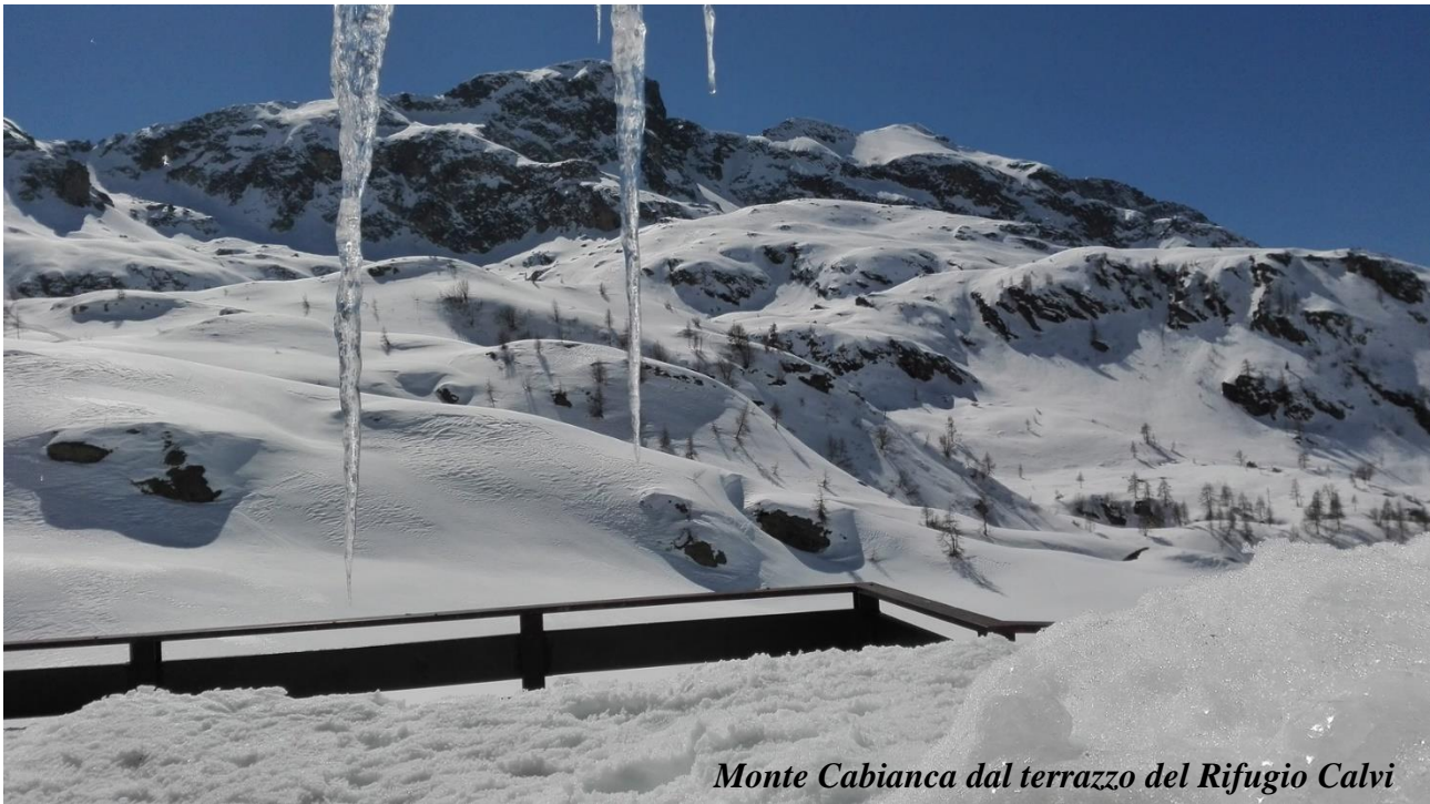
Monte Cabianca dal terrazzo del Rifugio Calvi