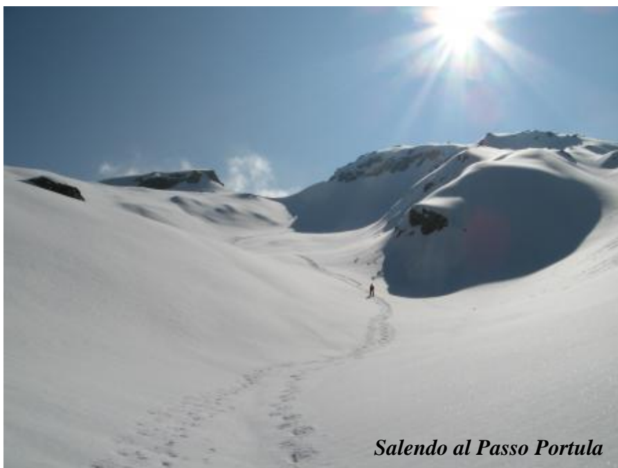
Salendo al Passo Portula