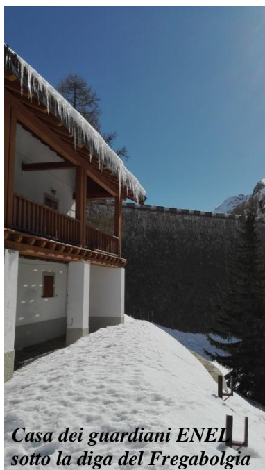
Casa dei guardiani ENEL sotto la diga del Fregaborgia

Il sentiero sale per un primo breve tratto in direzione Sud. Poi piega a sinistra (sud-est) risalendo un costone che conduce in breve (con neve compatta, circa 45 minuti) al passo Portula dal quale si gode un bellissimo panorama su entrambi i versanti.