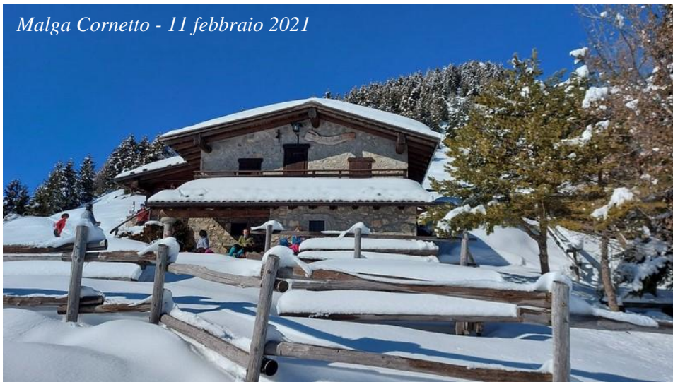
Malga Cornetto - 11 febbraio 2021

La strada entra poi nel bosco e perdendo quota scende nella valle di Campello, poco oltre il bivio che salendo porta alla Baita Cassinelli, la discesa e la strada prosegue pianeggiante per un lungo tratto andando infine ad innestarsi sulla strada statale della Presolana nei pressi dell'Albergo Spampatti (m 1260) poco distante dal nostro punto di partenza.