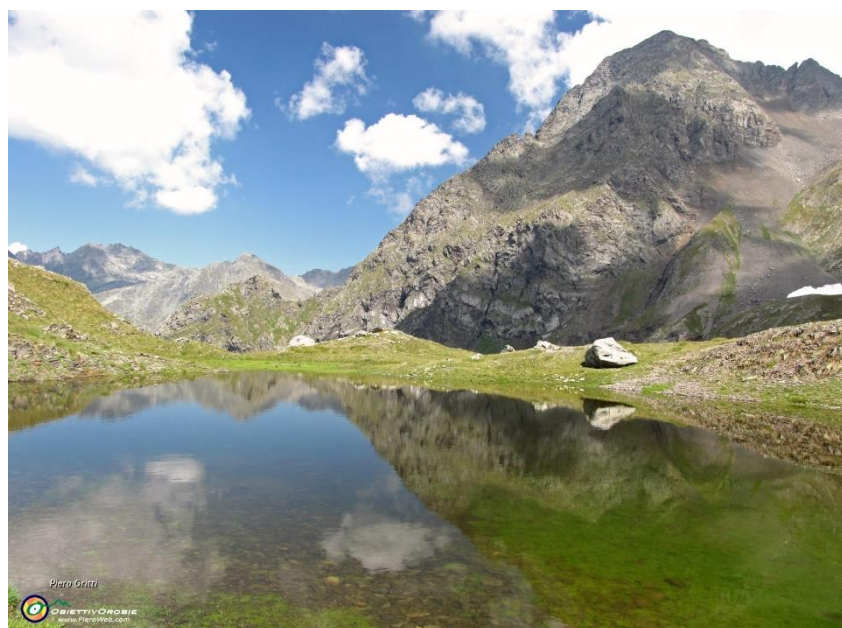
Il Monte Recastello visto dai lagheti di Val Cerviera

Qui giunti, si abbandona il sentiero CAI 321 che prosegue a sinistra verso il Monte Recastello, il Tre Confini e il Rifugio Tagliaferri, si devia invece a quindi per raggiungere in breve i laghi di Val Cerviera posti a quota 2326 m.