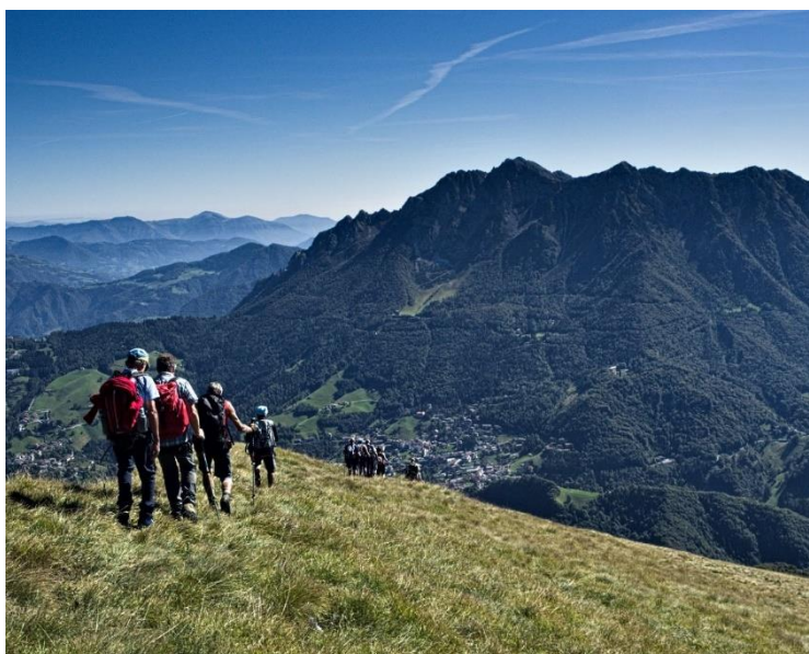
Il ritorno sulla dorsale del Chignol d'Aral