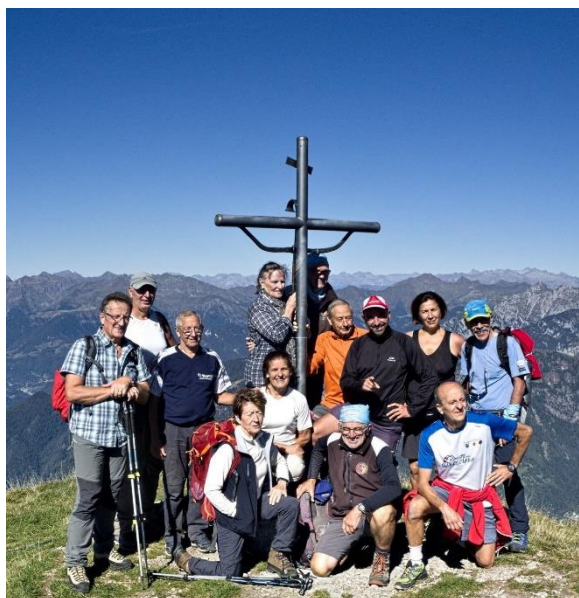
Il gruppo in vetta al Menna - 27/09/2018

, per quest'ultima opzione occorre salire alla croce di Zorzone (2050 m) e poi sulla punta più alta del Chignol d'Arale (2068 m), a questo punto la discesa può cominciare, scendiamo la lunga, panoramissima cresta, seguendo la labile traccia lungo i prateroni di erba secca e scivolosa fino ad abbassarci ai pascoli della Cascinetta di Menna, qui troviamo degli splendidi faggi secolari ed un piccolo stagno; a questo punto il sentiero ricompare ai nostri occhi e ci conduce fino ad una mulattiera che dopo un paio di tornati prosegue semi pianeggiante fino a riprendere il sentiero CAI 234 per l'ultimo tratto di discesa fino al punto di partenza, al parcheggio di Zorzone.