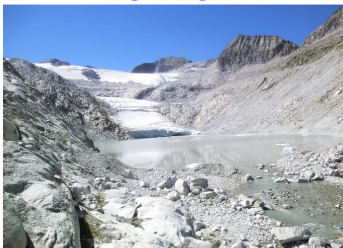
Lago e Vedretta del Pisgana

Da: Val Sozzine - Ponte di Legno (m 1315) Sent.(sterrato) 642 (strada) ↑ incrocio 644 x Castellaccio (m 1745) ↑ 1ª Cascata del Narcanello (m 2000) ↑ 2ª Cascata del Narcanello (m 2200) ↑ Lago Pisgana (m 2540) Facoltativa: Vedretta di Pisgana (m 3015) Ritorno: Per lo stesso sentiero di salita Dislivello tot.: m.1200 Lungh. Km 14 Tempi indicativi: Intero giro 6 ore circa Difficoltà: E (facile) fino alla 1ª cascata Difficoltà: EE (esc esperti) fino al lago e oltre Ritrovo: ore 6:00 via Sottocorna ( presepe)