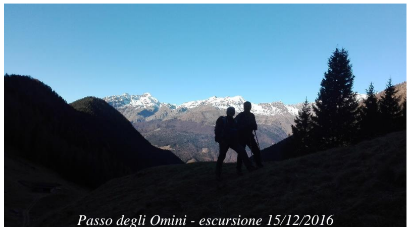
Passo degli Omini - escursione 15/12/2016

Agganciato il sentiero 134 lo si scende passando prima dalla Baita Alta di Regada (1807m) e poi dalla Baita Bassa di Regada (1551 m) per discendere poi alle Baite Moschel (1265 m).