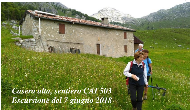
Casera alta, sentiero CAI 503 Escursione del 7 giugno 2018

DISCESA: La più breve è lo stesso sentiero di salita, ma volendo fare il giro completo (Periplo dell'Alben) si può dalla vetta ritornare al Passo della Forca e scendere verso ovest alle vaste praterie delle Casere Alte (1.568 m). Si passa nei pressi di una cappelletta e per sentiero segnalato si prosegue lungamente senza perdere quota fino alla stretta incisione del Passo del Sapli' e si scende nel bosco. Ad un bivio il sentiero di sinistra scende sempre per bosco fino al paese di Serina; quello di destra prosegue in piano e raggiunge la Baita Mussa Alta, dalla quale per sentiero si scende a collegarsi con la strada degli impianti di sci della conca dell'Alben. Per la medesima strada in direzione est si ritorna al Passo della Crocetta. Tempo di Discesa: 2.30 ore.