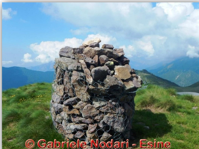
Monte Busma (m 2136)

Da: Fondi di Schilpario (m 1277) ↑ Rifugio Cimon della Bagozza (m 1578) ↑ Passo del Vivione (m 1833) Sentiero CAI 415 ↑ Malga Gaffione (m 1820) ↑ Monte Busma (m 2136) Ritorno: stesso sentiero di salita Dislivello totale: m 975 Lungh. Km 17 Tempi indic.: Intero giro ore 6.00 circa Difficoltà: E (escursione in ambiente innevato) Ritrovo: ore 7:00 via Sottocorna ( presepe)