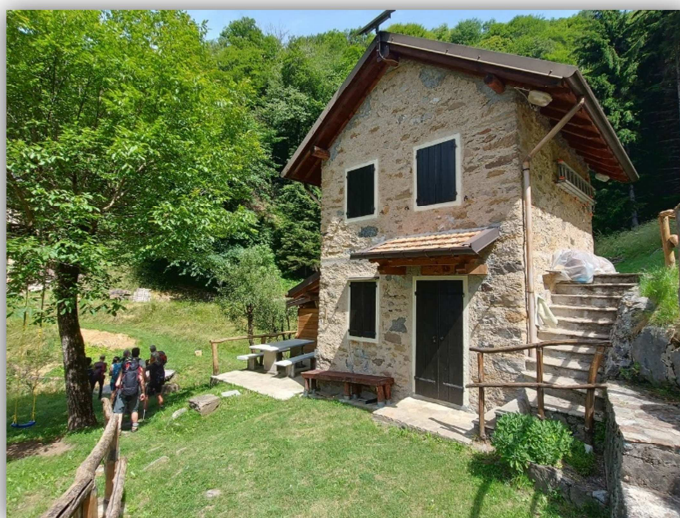
Alpe Era – (escursione del 22 giugno 2023)

NB: Escursione in gemellaggio con il gruppo "ESCARGOT"