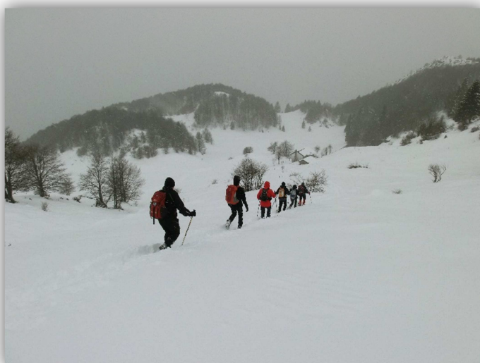
Verso Foppa Lunga (escursione del 10/01/2014)

Ritrovo: ore 7:00 via Sottocorna ( presepe)