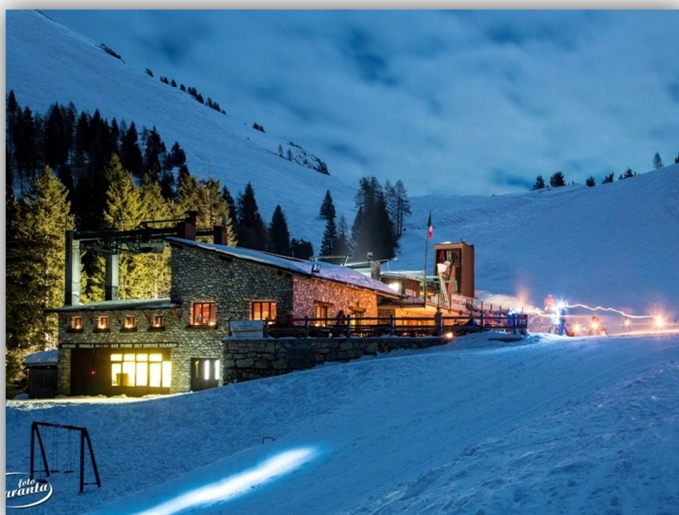
Rifugio vodala (m 1616)

NB. Aperture serali ogni Giovedì e venerdì Ristorante aperto, solo selfservice