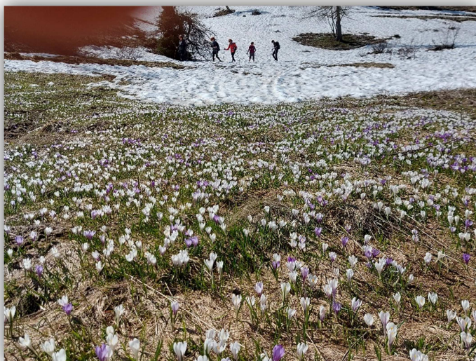
La via dei Silter – (escursione del 27/05/2021)

Ritrovo: ore 7:00 via Sottocorna ( presepe)