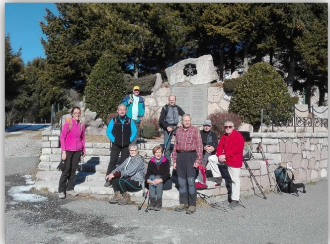
Monte Torrezzo – (escursione 21 nov 2019)

Ritrovo: ore 7:00 via Sottocorna ( presepe)