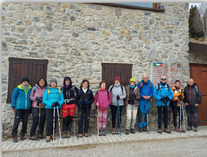
Rifugio Malga Lunga (escursione 10 feb 2022)