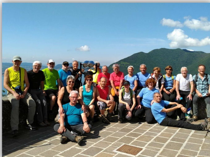
Montisola, 10 mag 2018 (forte partecipazione)