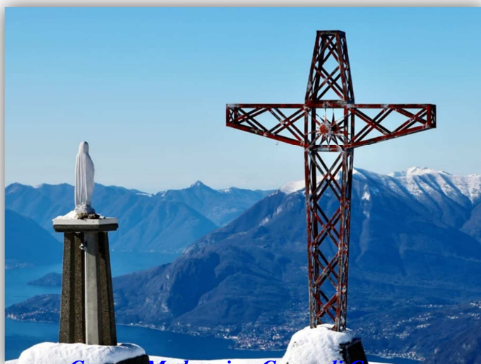
Croce e Madonnina Corna di Camozzera

Da: Laghetto del Pertus (m 1311) DOL e CAI 571 (periplo della Val Imagna) ↓ Convent del Pertus (m 1180) → Passo del Pertus (m 1195) CAI 588 ↓ Corna Camozzera (m 1452) ↑ La Passata (m 1246) DOL e CAI 571 ↓ passo del Portus (m 1160) ↑ Su stesso sentiero fino al Laghetto del Pertus Dislivello totale m 800 Lungh. Km 9.2 Tempi indicativi: andata e ritorno ore 5÷6~ Difficoltà: EE (escursionisti Esperti) Ritrovo: ore 7:00 via Sottocorna ( presepe)