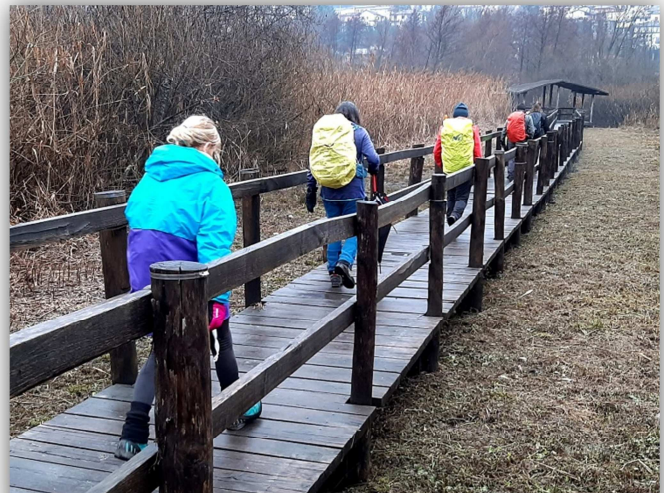
Passerella che collega le due sponde del lago

Ritrovo: ore 7:00 via Sottocorna ( presepe)