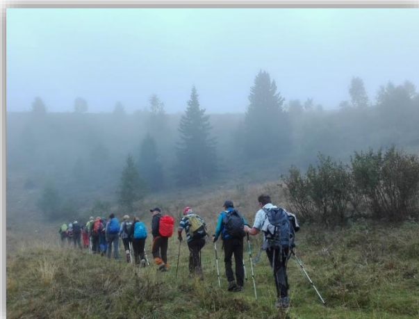
Anello Zuccone dei Campelli (22 set 2016)