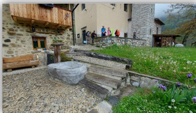
Il borgo antico di Ave (m 1098)