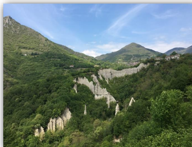
Le Piramidi di Zone

Ritrovo: ore 6:30 (Villa Regina P.) in auto fino a Pisogne, poi in treno fino a Pilzone