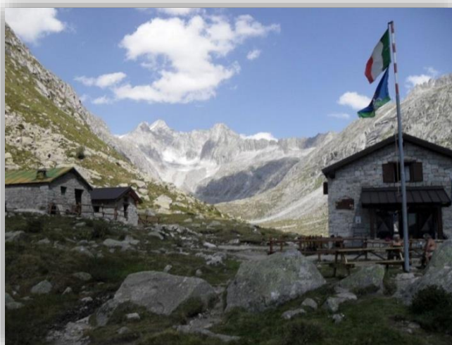
Baita Adamé (8 settembre 2016)