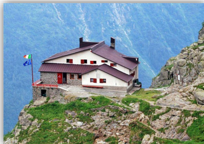
Rifugio M. Merelli al Coca (m1892)