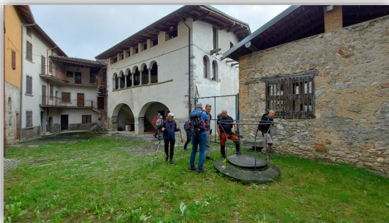
Amagno: cortile interno con la bocca della ghiacciaia

Da: Amagno di Strozza (m.440) Ad Anello: ↑ Cà Liggeri (m.605) ↑ S. Defendente (m.760) ↑ Roncola Bassa (m.850) ↑ Curta Fè ↑ Foppe ↑ B.ta Cal ↑ Monte Linzone (1392) ↓ B.ta Semiletto ↓ Roncola alta (m.970) ↓ Roncola bassa ↓ S. Defendente ↓ Cà Maldrotti (m.695) ↓ Amagno Dislivello tot.: m1158 Lg Km 13.6 Tempi indic.: intero giro ore 5 Difficolta: E (Escursionistico) Ritrovo: ore 7.00 (Villa R.P.)