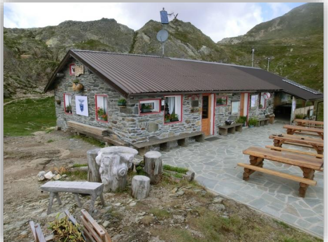
Rifugio Tagliaferri (11 settembre 2014)