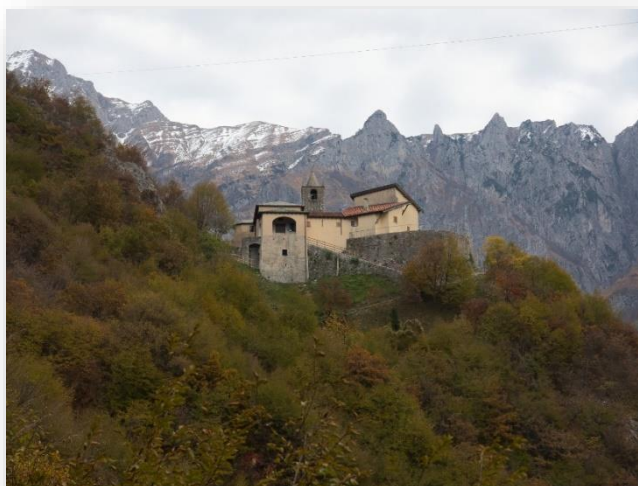
Santa Maria sopra Olcio (11 nov 2021)