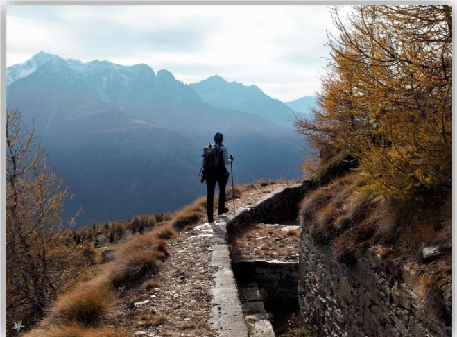
Il Trincerone (26 ottobre 2017)