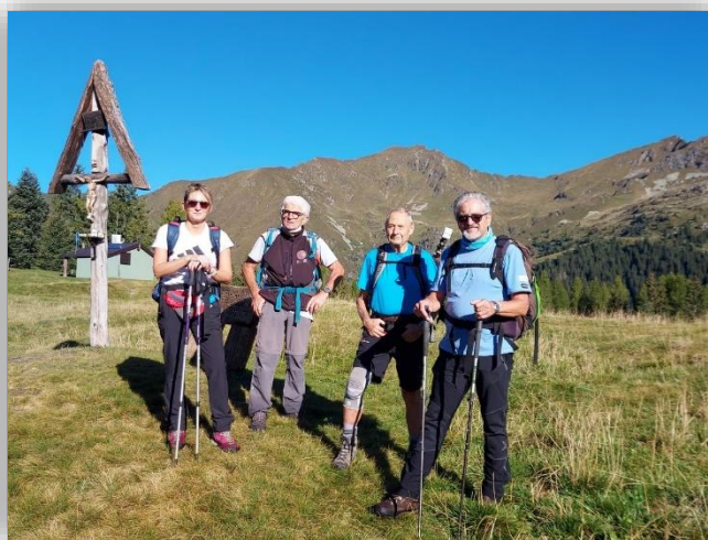
Baita di Costa Piana (17 settembre 2021)