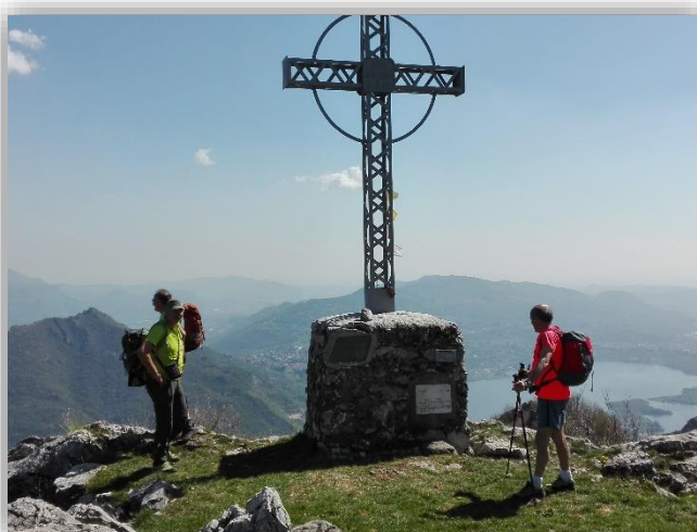
Corni di Canzo C. orientale (6 aprile 2017)