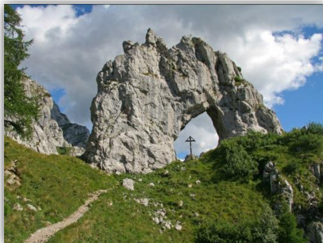
Bocchetta di Prada (esc. 13 giugno 2013)