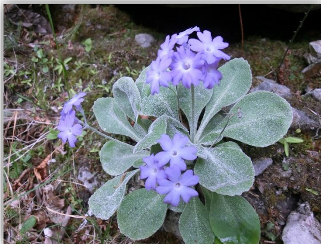
Primula albenensis (endemica del M. Alben)