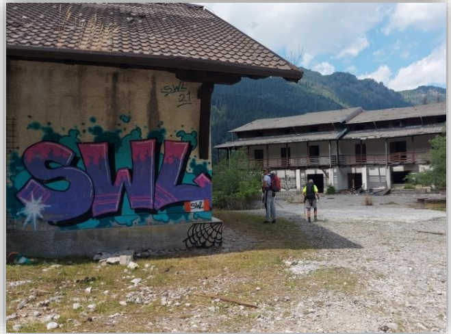
Ex impianti di Valcanale (Hotel Sempreve)