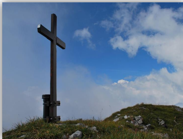
Cima del Vigna Vaga