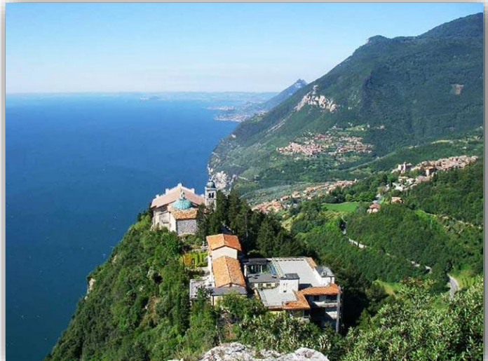
Santuario del Monte Castello

Ritrovo: ore 6:00 via Sottocorna ( presepe)