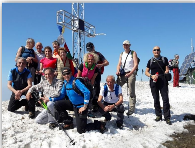
Sulla vetta del Monte San Primo (18/04/2018)

NB: per farla meno impegnativa, l'escursione Può terminare al Rifugio Martina (m 1231) per ricongiungersi al gruppo al Parco M. San Primo: così facendo: Difficolta: E (escursionismo) Dislivello tot.: m.910 Lungh. m 13,7