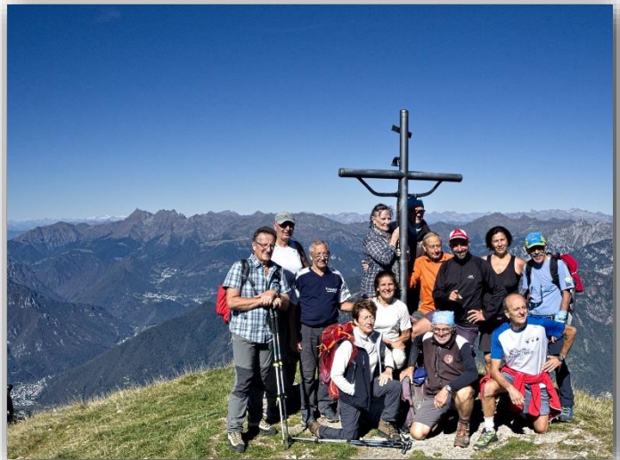
Sulla vetta del Menna (27/09/2018)

Ritrovo: ore 6:30 via Sottocorna ( presepe)