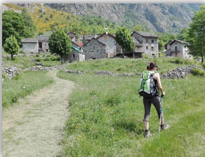
La Piana di Bresciadega (01/06/2017)

Ritrovo: ore 6.00 via Sottocorna (presepe)