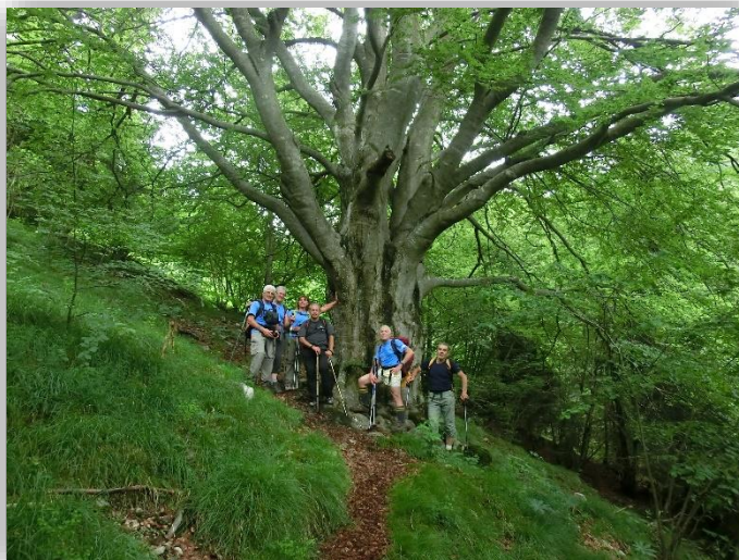
Il Gigante della Val Dossana (26/06/2014)

Da: Premolo parch. di via Mutti (m 640) ↓ incrocio CAI 242 (da Parre m 573) ↑ Malga Piazza Manzone (m 860) ↑ Faggio Gigante Val Dossana (m 1200~) ↑ Baita de Sura (m 1296) ↑ Baita rif. Santamaria in Leten (m 1770) ↑ Cima di Leten (m 2093) Facoltativa Sent.240/245 ↓ Baita Val Mora (m 1860) ↓ Cascinetto Rinati (m 1356) ↓ Baita Costa Bruciata (m 1069) ↓ Malga Piazza Manzone (m 860) ↓ Cascina Cà Loa (m 780) ↓ Le Bratte (m 720) ↓ via Mutti (m 640) Dislivello totale: m.1680 Lungh. Km 20.5 Tempi indicativi: Intero giro 6 ore circa Difficoltà: E (escursionistico) Ritrovo: ore 6:30 via Sottocorna (presepe)