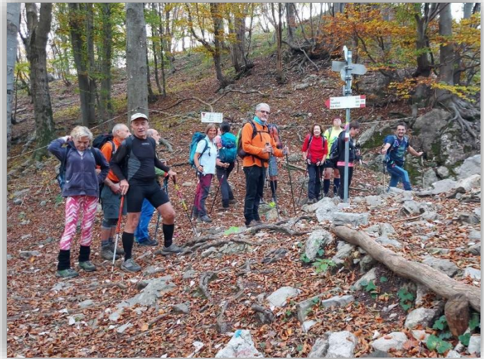
La Passata (22/10/2022)

Ritrovo: ore 6:30 via Sottocorna (presepe)