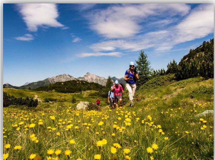
Giro dei sette laghi (28/06/2018)