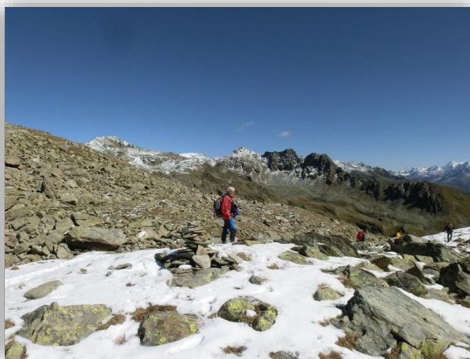
Laghi Seroti (21/09/2017)

Ritrovo: ore 6.00 via Sottocorna (presepe)