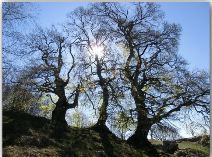
I Tre Faggi di Fuipiano (09/03/2017)

Ritrovo: ore 6:30 via Sottocorna ( presepe)