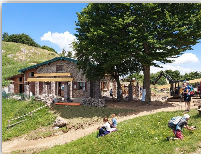
La sosta al Rifugio Medelet (24/06/2021)

Da: Passabocche di Val Palot BS (m.1290) S.via 201 ↑ Bivio Le Passate (m.1420) ↑ Rifugio Medelet (m.1552) ↑ Punta Caravina (m.1850) ↑ Malga Palmarusso di Sopra (m.1842) ↑ Rifugio e chiesetta Almici (m.1869) S.via 3V ↑ M.te Guglielmo (1948) S.via 325 ↓ Malga Staletti Alti (m.1674) S.via (direz.N-O) ↓ C.na Marsa (m.1520) S.via 326 → Malga Gale (m.1559) S.via (direz.N-O) → Malga Medelet (m.1578) → Incrocio sentiero di salita S.via 201 ↓ Rifugio Medelet ↓ Parch. di Passabocche Dislivello Totale: m.750 lungh. Km 12.5~ Tempi indic.: per l'intero giro h. 6.00~ Difficoltà: E (Escursionismo) Ritrovo: ore 7:00 via Sottocorna (presepe)