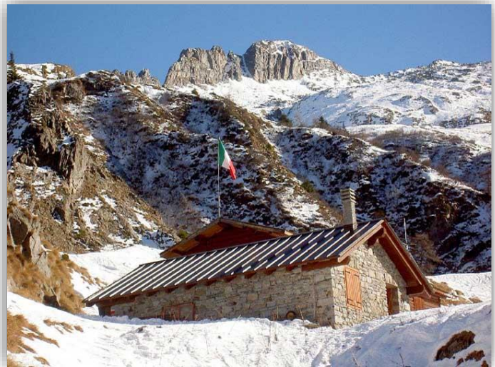
Rifugio Prandini (m 1950)

Ritrovo: ore 6.30 via Sottocorna (zona presepe)