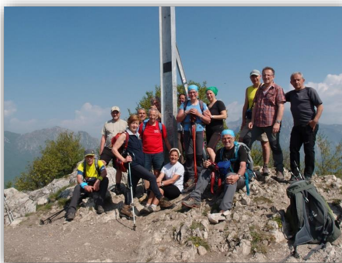
Sulla vetta del Monte Barro (26/04/2018)