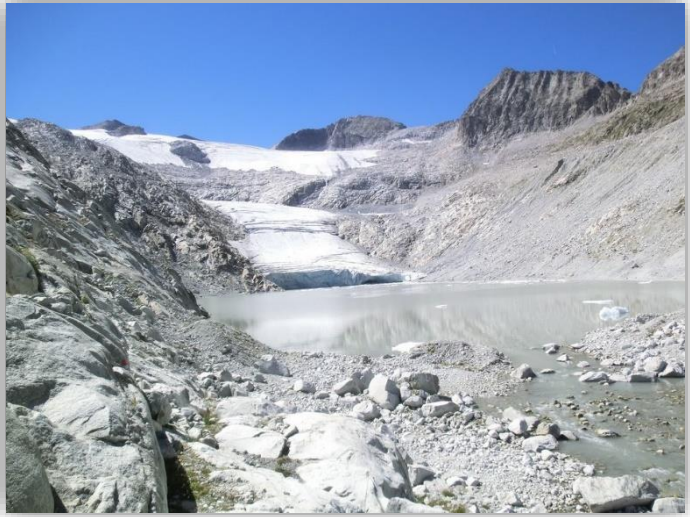
Lago e Vedretta Pisgana (m 2540)

Ritrovo: ore 6:00 via Sottocorna (presepe)