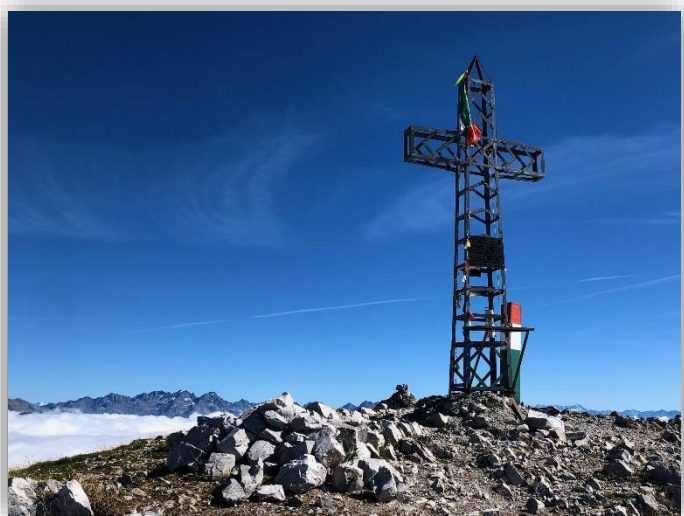
Croce del Pizzo Arera (m 2512)

Ritrovo: ore 6:30 via Sottocorna ( presepe)