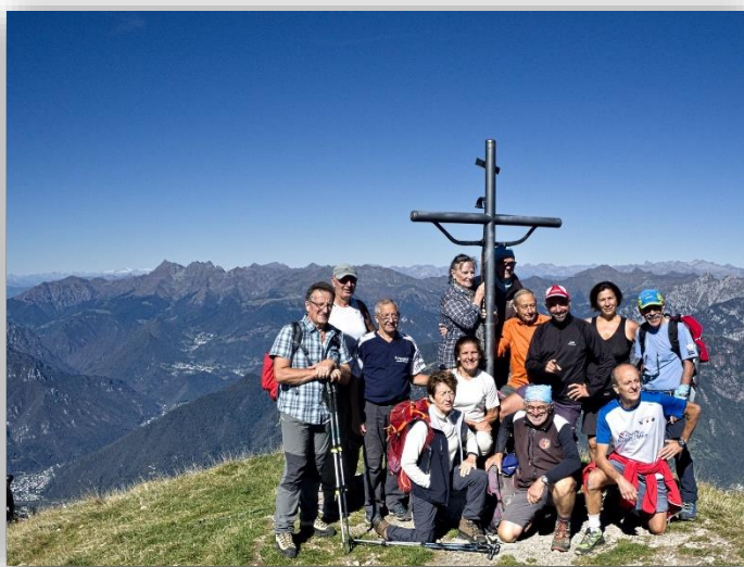
Sulla vetta del Menna (27/09/2018)

Ritrovo: ore 6:30 via Sottocorna (presepe)