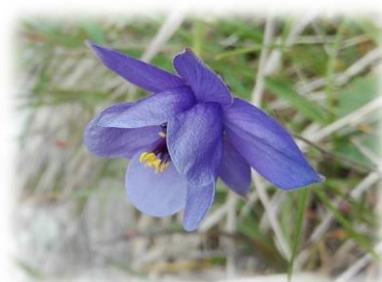
Tra i fiori più comuni sulla strada delle 52 gallerie del Pasubio