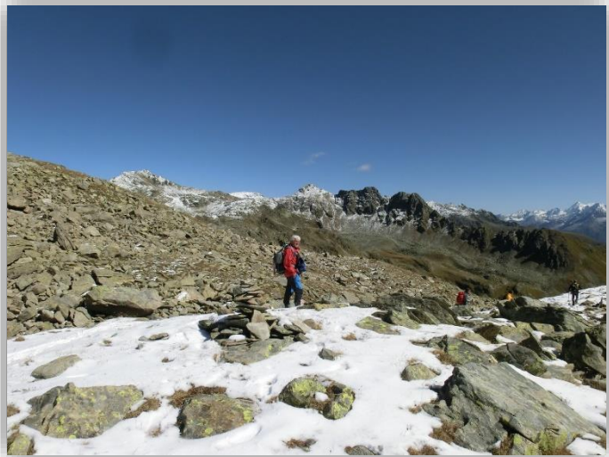
Laghi Seroti (21/09/2017)

Ritrovo: ore 6.00 via Sottocorna ( presepe)