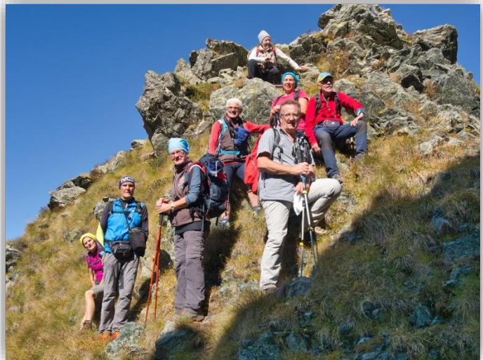
Bocchetta dei Lupi (03/10/2019)

Ritrovo: ore 6.30 via Sottocorna (presepe)