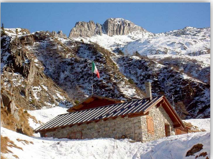
Rifugio Prandini (m 1950)

Ritrovo: ore 6.00 via Sottocorna (presepe)