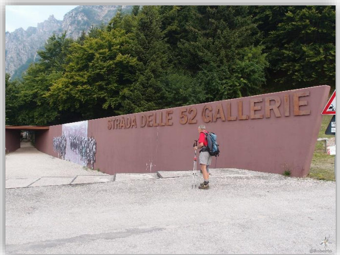
Strada delle 52 gallerie del Ppasubio (escursione del gruppo del 20/07/2017)