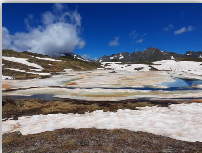
Laghi della Val Cerviera (m 2320)

Ritrovo: ore 6.30 via Sottocorna (presepe)